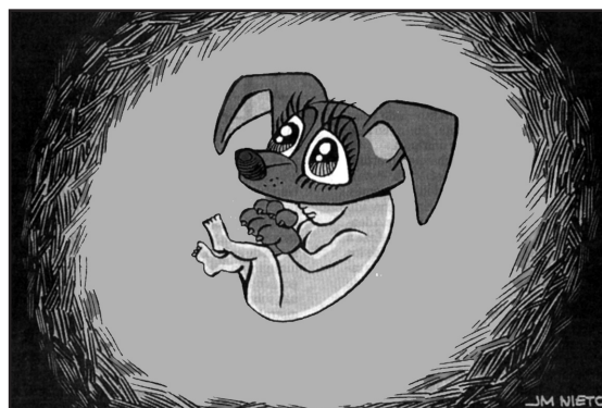
ABC, 12 de febrero, 2023

Ahí tenemos la nueva Ley de Bienestar Animal, aprobada por el Congreso, el 12 de enero de 2023.