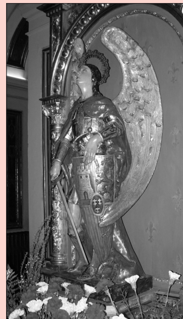
¡A ti acudimos...!

Del olvido de Dios, libranos. De las guerras, libranos. De todo mal, libranos. Ayúdanos, protégenos y sálvanos.