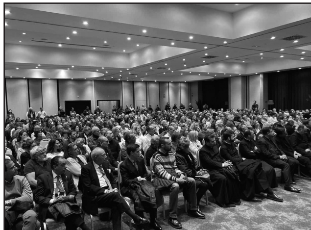
Nuestro director segundo por la izquierda en primera fila