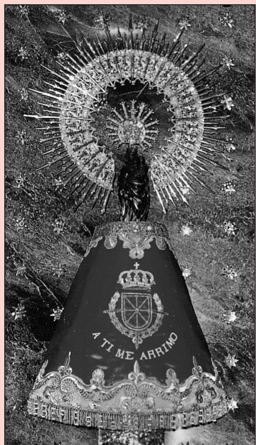
¡Bendita y alabada sea la hora...!

Ángel Custodio de España, tan olvidado. A ti acudimos en estos tiempos difíciles. Dios te ha encomendado la misión de ser nuestro Protector y Defensor en el peligro. Te imploramos para que nos guíes en medio de las tinieblas de los errores humanos y seas nuestro escudo protector ante los enemigos exteriores e interiores de nuestra Patria, alcancemos la reconquista de la Unidad Católica de España y podamos ver la restauración del Reinado Social del Sagrado Corazón de Jesús, y de esta forma España vuelva a ser el paladín de la Fe Católica. Ángel Custodio de España: